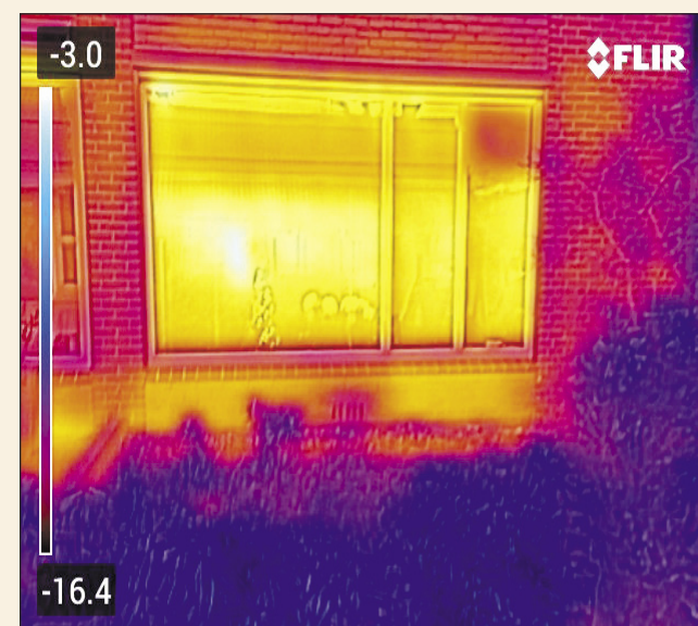
Voorbeeld van de warmtefoto die laat zien waar de woning warmte verliest.

Elke week schrijven vertegenwoordigers van Nieuwe Lijn in een persoonlijke column over zaken waar zij mee bezig zijn, wat hen inspireert of overkomt. Voor overig nieuws en informatie is Nieuwe Lijn regelmatig met haar informatiekraam te vinden in het centrum van Vaassen. Heb je ook interesse om actief te worden bij Nieuwe Lijn of wil je ons ondersteunen door lid te worden? Stuur een berichtje naar info@nieuwelij.nl .