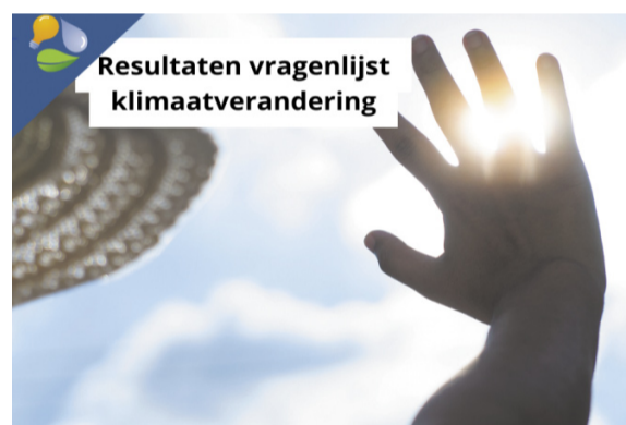
Resultaten vragenlijst Klimaatverandering

Bedankt voor uw waardevolle bijdrage. Samen werken we aan een klimaatbestendige gemeente.